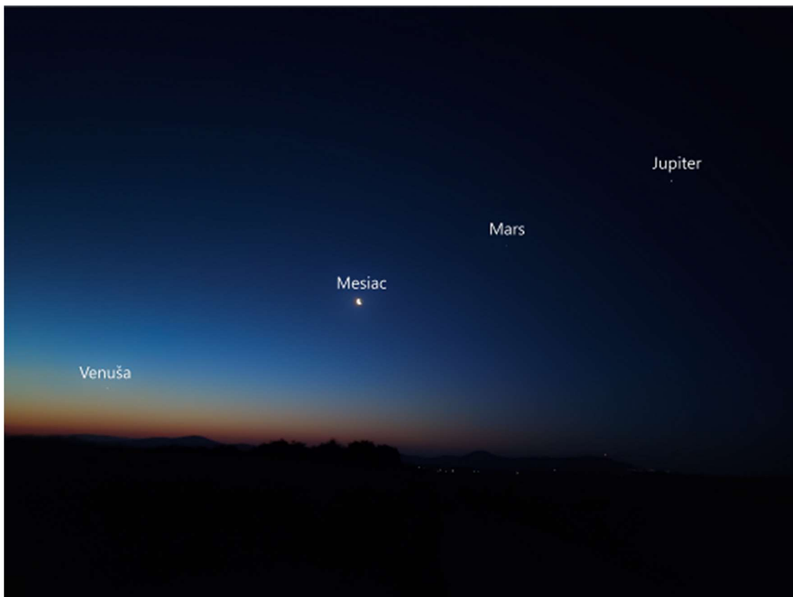
Snímek „Priamka vesmírnych objektov“ Davida Gerarda (1. miesto ve fotografickej kategorii soutěžících do 17 let)