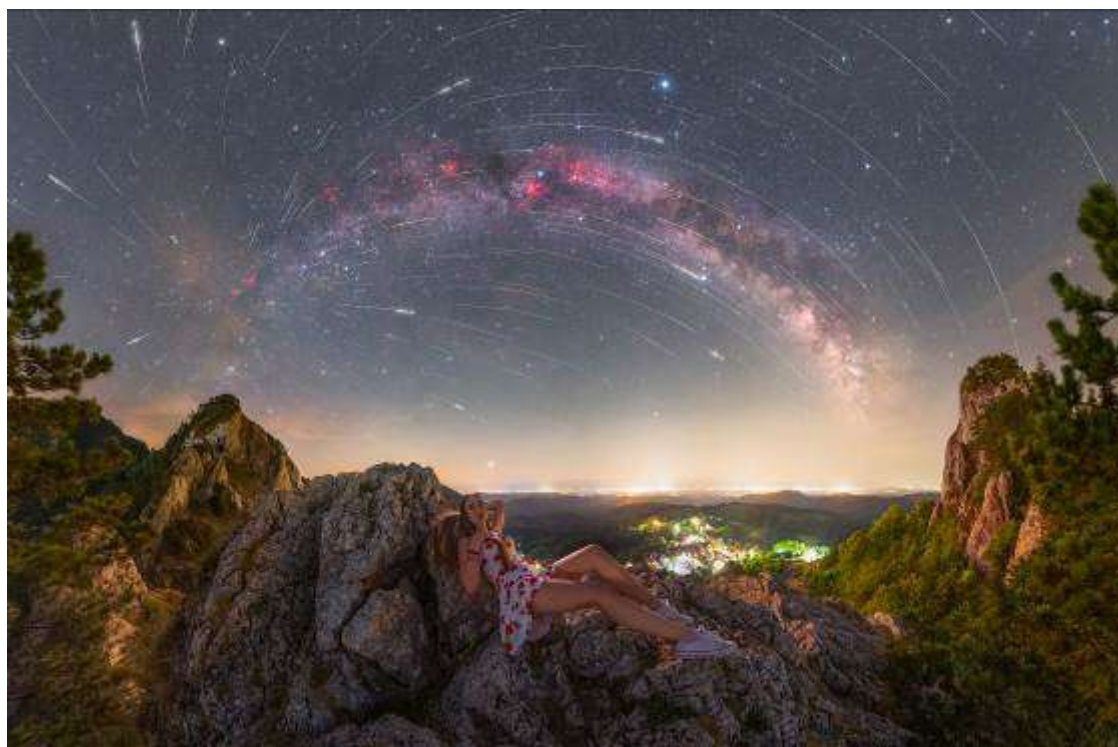
Snímek „Perzeidy 2022“ Maja Chudého (1. miesto ve fotografickej kategorii soutěžících nad 18 let, nositel mimořádné Ceny Hvězdárny Žebrák a Hvězdárny Pardubice)