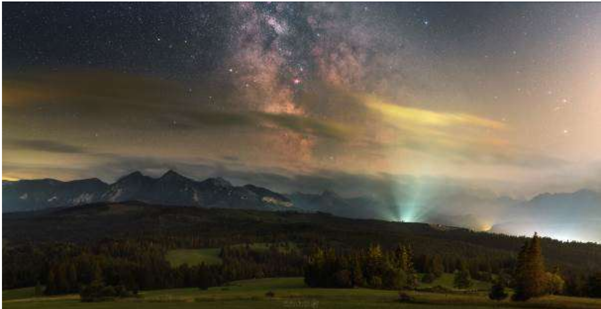
Snímek „Miznúca nočná obloha“ Ondreje Králika (1. místo v kategorii Světelné znečištění)