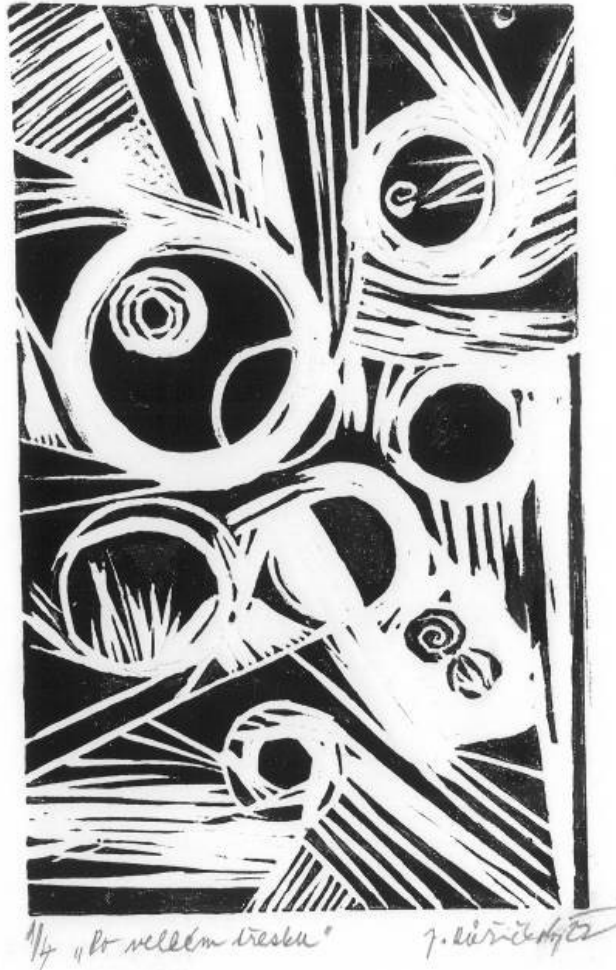
Obrázek „Po velkém třesku“ Josefy Růžičkové (mimořádné čestné uznání, nejstarší účastník soutěže)