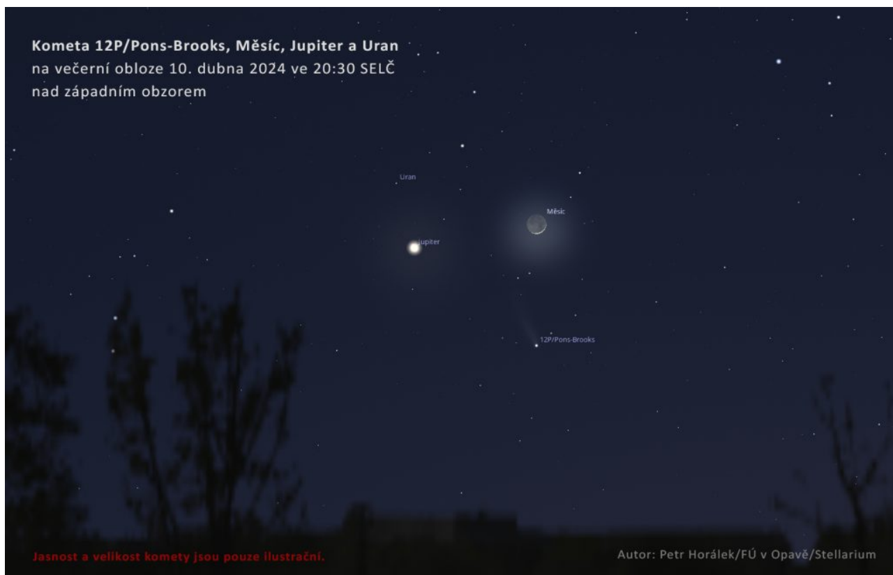
Seskupení komety 12P/Pons-Brooks, Měsíce, Jupiteru a Uranu 10. dubna 2024.

Pro fotografování komety potřebujete především místo s nerušeným výhledem od západu k severozápadu a tmavou oblohu mimo města. Pro fotografování je zapotřebí stativ, aparát umožňující delší expozice a světelný objektiv s ohniskovou vzdáleností od 24 mm výše – aby na snímku vynikla hlava komety a alespoň náznak ohonu. Kometu vyhledáte podle mapky, objektiv doostříte a zvolíte tak vysoké ISO, aby se ještě neprojevil šum, a tak dlouhé expozice (v řádu několika sekund), aby se hvězdy ještě vlivem zemské rotace neprotáhly. Hlava komety bude na snímku malá a nápadně zelenomodrá. Kometa se takto dá zachytit i na lépe vybavené chytré telefony. Snímky s detaily v ohonu a kometou přes celé pole záběru ale nečekejte – takové záběry vznikají až přes teleobjektivy nebo teleskopy umístěné na speciálních montážích, kterými disponují zkušenější astrofotografové.