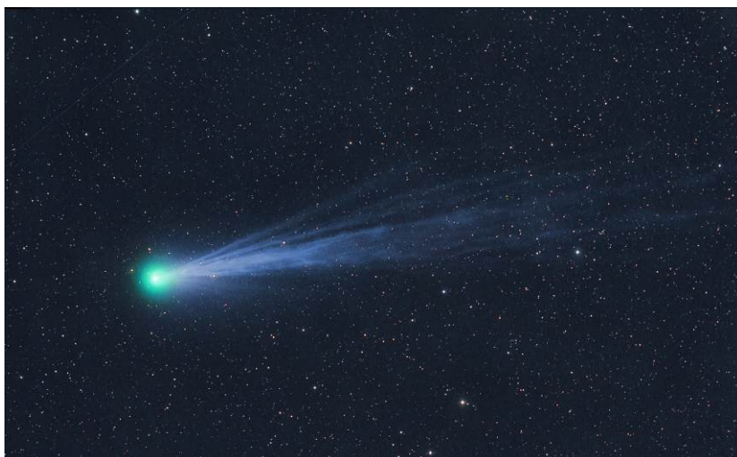
Ohony komety 12P/Pons-Brooks ze 3. března 2024.

Zatímco jasná hlava komety je snadno pozorovatelná už nyní v malých triedrech a v následujících týdnech bude zjasňovat, ohony komety jsou slabé. Prašný ohon se kvůli poloze komety vůči Zemi zatím velmi neukazuje, iontový je na